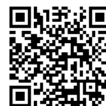
川内キャンパス地図QRコード