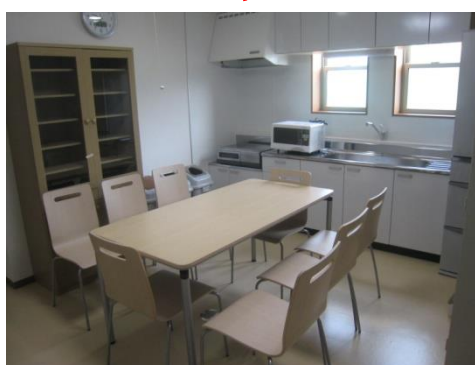
オープンリビング