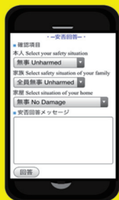
専用アプリからの回答画面(例)

4月24日(月)、10月27日(金)正午に、 全学一斉安否情報登録訓練を実施しますので、必ず協力してください！ ※平成29年度は、実際の中小地震(送信基準(震度6弱)未満)発生の際にも、訓練を実施する場合がありますので、 その際もご協力ください！