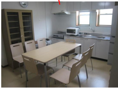
オープンリビング